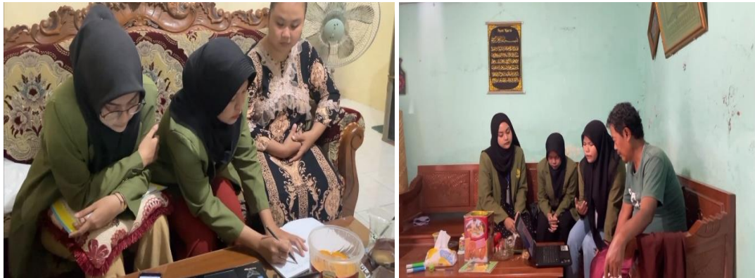
Gambar 3. Sosialisasi Pembukuan

Sosialisasi pembukuan sederhana dilakukan secara home to home dengan mengunjungi rumah pelaku UMKM “Bila Catering” dan tahu tempe “Pantura”. Pada UMKM “Bila Catering” sosialisasi dilakukan pada tanggal 29 Mei 2023 sedangkan pada tahu tempe “Pantura” dilakukan pada tanggal 2 juni 2023. Sosialisasi dilakukan dengan tujuan untuk menumbuhkan kesadaran UMKM akan pentingnya penerapan praktek pembukuan sederhana. Sosialisasi ini memaparkan materi tentang pencatatan pembukuan sederhana secara manual maupun digital. Sosialisasi ini diberikan karena penyusunan laporan keuangan penting dilakukan agar UMKM dapat mengetahui keluar masuknya keuangan.