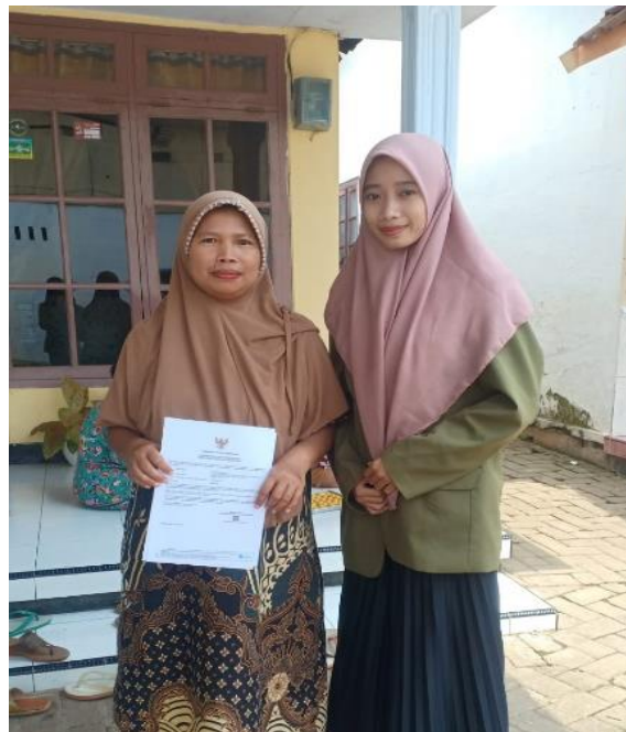
Gambar 6. Penyerahan NIB