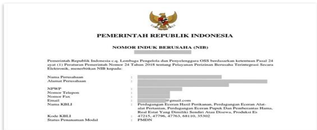
Gambar 5. Contoh Dokumen NIB