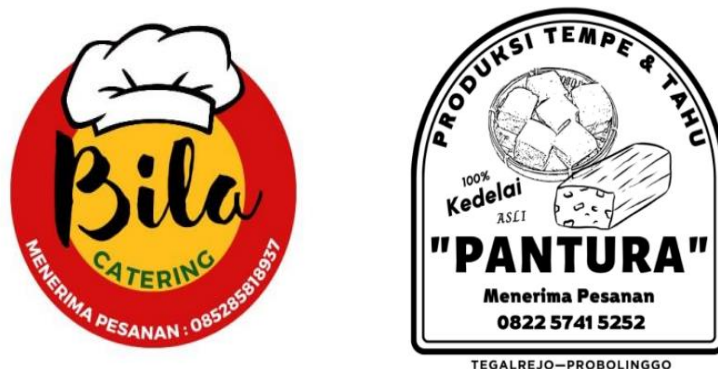
Gambar 7. Hasil Logo Branding

Pendampingan yang pertama yaitu pembuatan logo pada “Bila Catering” dan tahu tempe “Pantura”. Pada suatu usaha yang melakukan branding pasti membutuhkan logo karena logo merupakan salah satu elemen terpenting dalam branding. Logo tentunya terdiri dari elemen yang digabungkan menjadi gambar aset seperti kartu nama, situs web, media sosial, pasar, serta dalam iklan pemasaran bisnis. Logo melambangkan arti tersendiri atau ciri khas produk UMKM tersebut. Logo “Bila Catering” dibuat dengan menggunakan aplikasi Canva dengan elemen sederhana dan arti bila catering juga merupakan nama singkatan dari anak pemilik UMKM tersebut, dimana hal ini sesuai dengan permintaan dari pelaku usaha. Sedangkan pembuatan logo pada UMKM tahu tempe “Pantura” juga menggunakan aplikasi Canva. Arti “Pantura” tersebut diambil dari pengalaman beliau saat sebelum mendirikan usaha tahu tempe yaitu bekerja menjadi sopir truk yang sering melaju dijalan Pantura.