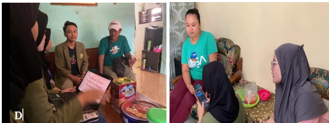
Gambar 2. Sosialisasi Branding

Sosialisasi tentang branding ini dilakukan dengan metode home to home dengan mengunjungi rumah pelaku UMKM diantaranya adalah UMKM “Bila” catering dan tahu tempe pak Sugik “Pantura”. Sosialisasi pada “Bila Catering” catering diadakan dalam satu hari pada tanggal 18 Mei 2023 berlokasi di rumah pelaku UMKM “Bila catering” Dusun Krajan Rt 005 Rw 001, Desa Tegalrejo Kecamatan Dringu Kabupaten Probolinggo pada pukul 14.00-18.00. Sedangkan sosialisasi pada tahu tempe “Pantura” diadakan pada tanggal 17 Mei 2023 di rumah pelaku UMKM di Dusun Tegalgede Kulon Desa Tegalrejo. Sosialisasi branding dilakukan dengan memberikan materi tentang pentingnya branding bagi suatu usaha serta unsur apa saja yang ada pada branding seperti logo, foto produk, sosial media, serta labeling. Branding merupakan bagian penting dari suatu bisnis salah satunya pada UMKM. Membangun suatu usaha tentunya membutuhkan merek produk atau jasa untuk dapat menjalankan dan mengembangkan usahanya hingga dapat bersaing di pasar. Oleh karena itu, branding adalah proses untuk meningkatkan kesadaran merek dan dapat meningkatkan loyalitas para pelanggan. Dengan memiliki citra yang baik dimata konsumen, tentunya dapat meningkatkan daya tarik pada konsumen.