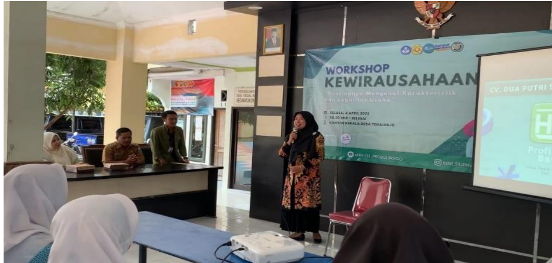
Gambar 1. Workshop Kewirausahaan