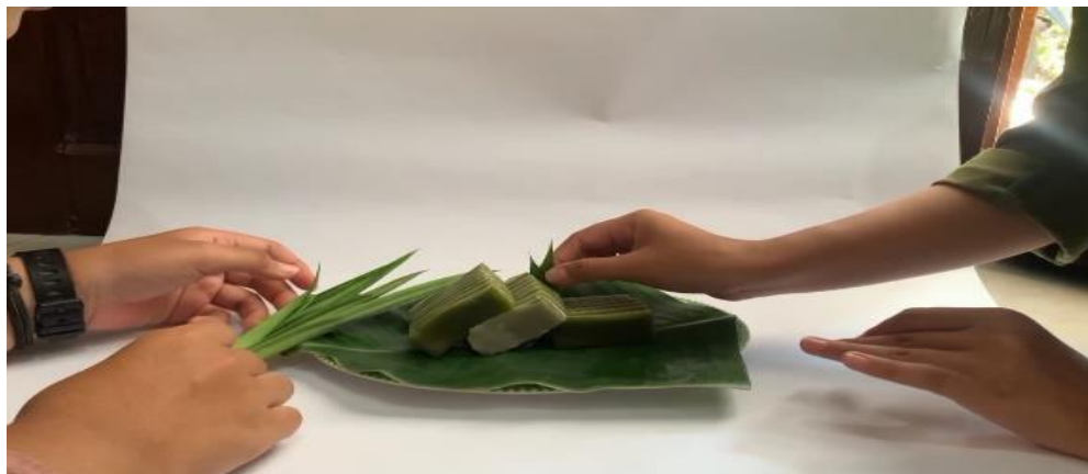
Gambar 8. Hasil Foto Produk