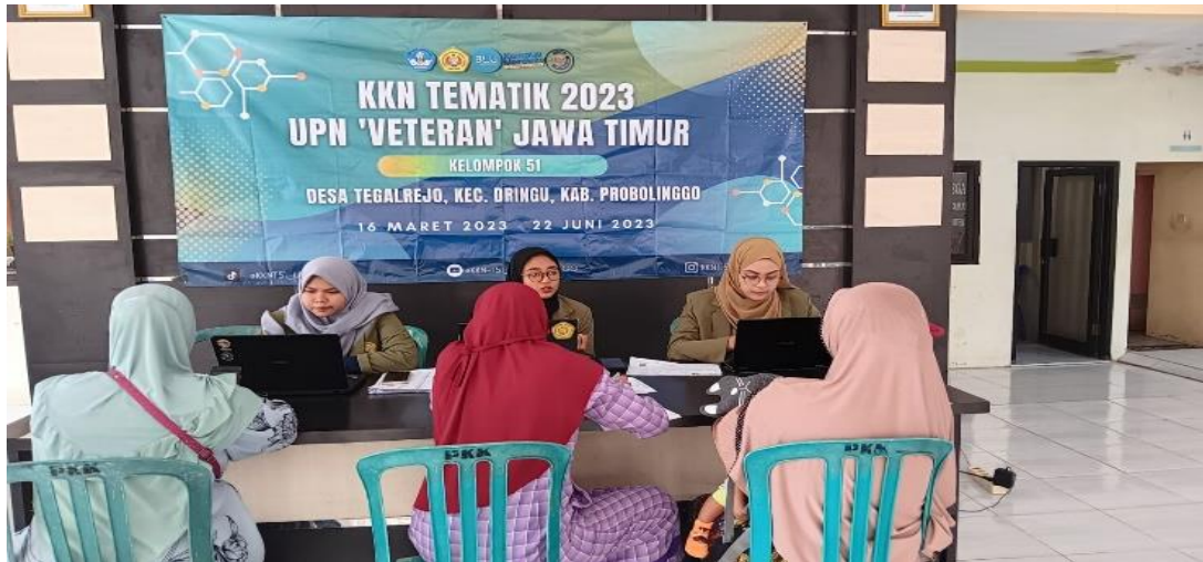
Gambar 4. Pendampingan Pembuatan NIB