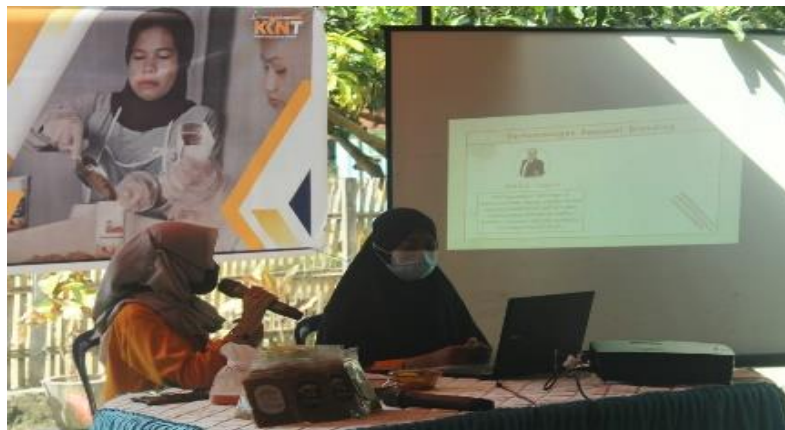
Gambar 5. Pemberian Materi Personal Branding

Pada proses pelaksanaan pelatihan kewirausahaan, mahasiswa KKN Tematik Universitas Negeri Makassar Tahun 2021 melakukan praktek memasak cara membuat abon ikan bandeng, penjelasan dan manajemen usaha. Selama proses pembuatan abon ikan bandeng, peserta pelatihan yang mayoritas dari ibu rumah tangga diberikan kesempatan untuk melihat proses pembuatan abon. Sembari menunggu pembuatan abon ikan selesai, pemateri yang juga dari mahasiswa KKN Tematik Universitas Negeri Makassar memaparkan materi tentang manajemen usaha khususnya bagaimana manajemen usaha pengolahan abon ikan bandeng yaitu mulai dari perencanaan pengolahan abon seperti biaya alat dan bahan, analisa kelayakan usaha, pelabelan dan pengemasan produk, serta cara pemasaran yang tepat. Selain itu, juga dipaparkan lebih dalam terkait personal branding suatu produk untuk lebih mengoptimalkan manajemen usaha.