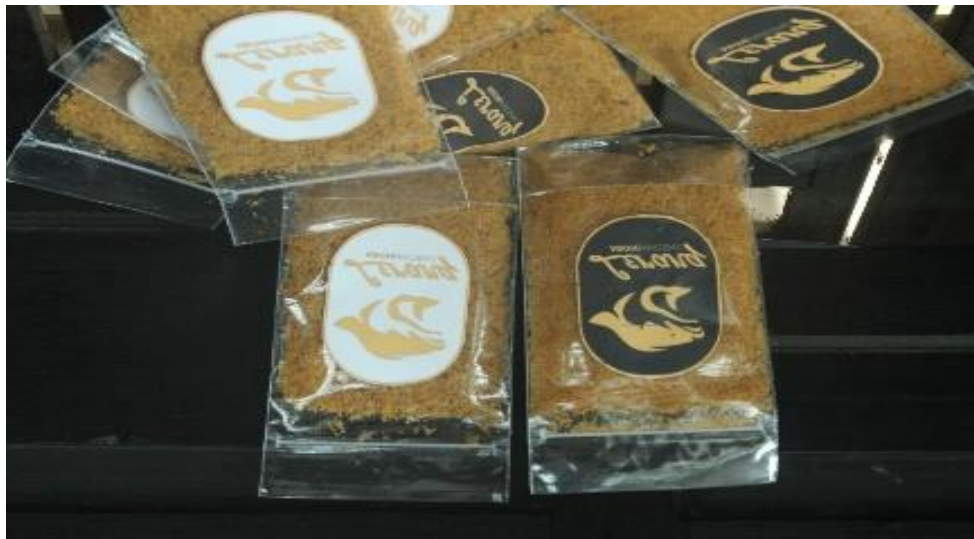
Gambar 7. Produk Hasil Pelatihan Kewirausahaan

Berdasarkan output dari pelatihan kewirausahaan ini, diharapkan mampu memberikan gambaran kepada masyarakat bagaimana menjadi wirausaha yang baik dan mampu melihat potensi alam yang ada disekitar yang dapat dijadikan usaha. Oleh karena itu, kegiatan pelatihan kewirausahaan ini merupakan solusi dalam upaya meningkatkan dan membangun perekonomian desa melalui kegiatan berwirausaha, apalagi di kondisi pandemi covid 19 saat ini.