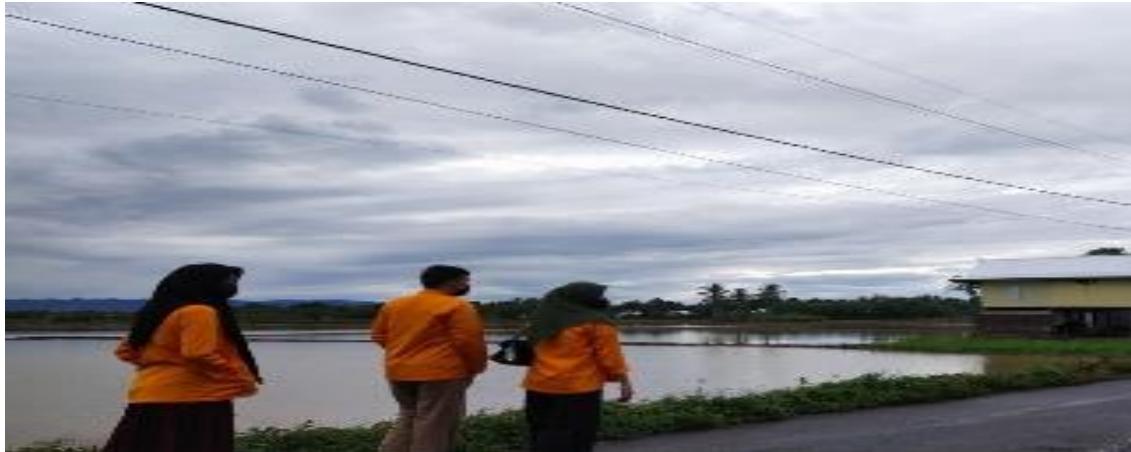
Gambar 2. Observasi desa

Oleh karena itu, Tim KKN Tematik Universitas Negeri Makassar memanfaatkan hasil alam yang ada yaitu ikan sebagai bahan utama dalam kegiatan lanjutan pelatihan kewirausahaan. Sehingga Tim KKN Tematik Universitas Negeri Makassar mengolah ikan menjadi olahan Abon Ikan. Setelah observasi Tim KKN Tematik Universitas Negeri Makassar melakukan beberapa persiapan diantaranya praktek pembuatan Abon ikan dan penyusunan materi pelatihan kewirausahaan.