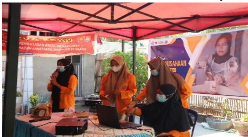
Gambar 6. Pemberian Materi Manajemen Usaha

Diakhir kegiatan pelatihan kewirausahaan, para peserta pelatihan diberi kesempatan untuk bertanya terkait materi yang telah dipaparkan sebelumnya oleh pemateri. Selain itu, peserta juga berkesempatan untuk mencicipi abon yang telah dibuat, kemudian memberikan pendapatnya terkait rasa ataupun kekurangan yang terdapat pada abon ikan bandeng yang telah dibuat. Dan tidak lupa pula, sebelum peserta meninggalkan lokasi pelatihan kewirausahaan, peserta diberikan buah tangan berupa abon ikan bandeng yang telah dikemas dan diberi label.