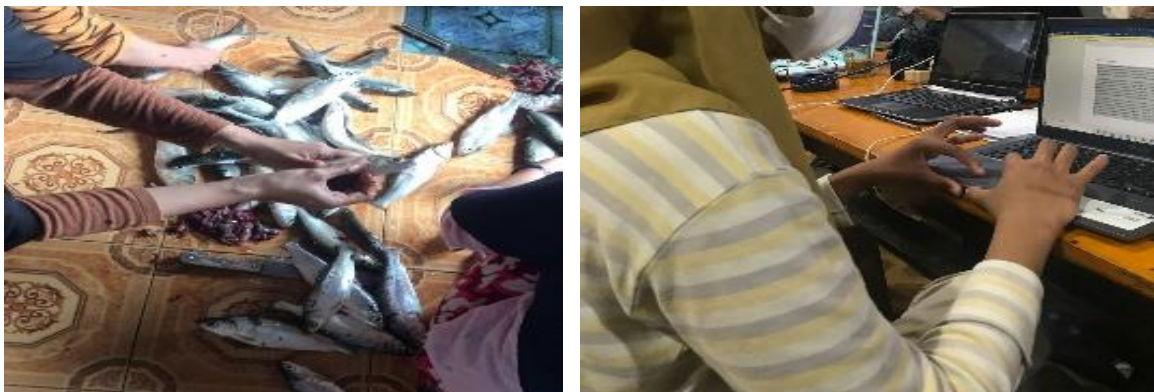
Gambar 3. Praktek pembuatan abon & penyusunan materi

Setelah tahap observasi dan persiapan, selanjutnya adalah tahapan pelaksanaan kegiatan. Pelatihan Kewirausahaan dilaksanakan pada tanggal 26 Agustus 2021 berlokasi di Posko KKN Tematik Universitas Negeri Makassar. pada tahapan ini peserta pelatihan kewirausahaan diberikan materi materi yang menunjang peserta dalam berwirausaha. Peserta terlebih dahulu diarahkan untuk ke meja registrasi untuk melakukan registrasi dan mengambil masker bagi peserta yang tidak menggunakan masker serta memakai hand sanitizer. Dimana, pelatihan ini terdiri dari 3 materi yaitu: pembuatan produk abon ikan, personal branding, dan manajemen berwirausaha. Setelah pemberian materi peserta diberikan kesempatan untuk bertanya seputar materi ataupun seputar kewirausahaan pada umumnya. Ketika proses tanya jawab selesai, kami membagikan kepada semua peserta produk abon ikan yang telah kami buat untuk dicoba.