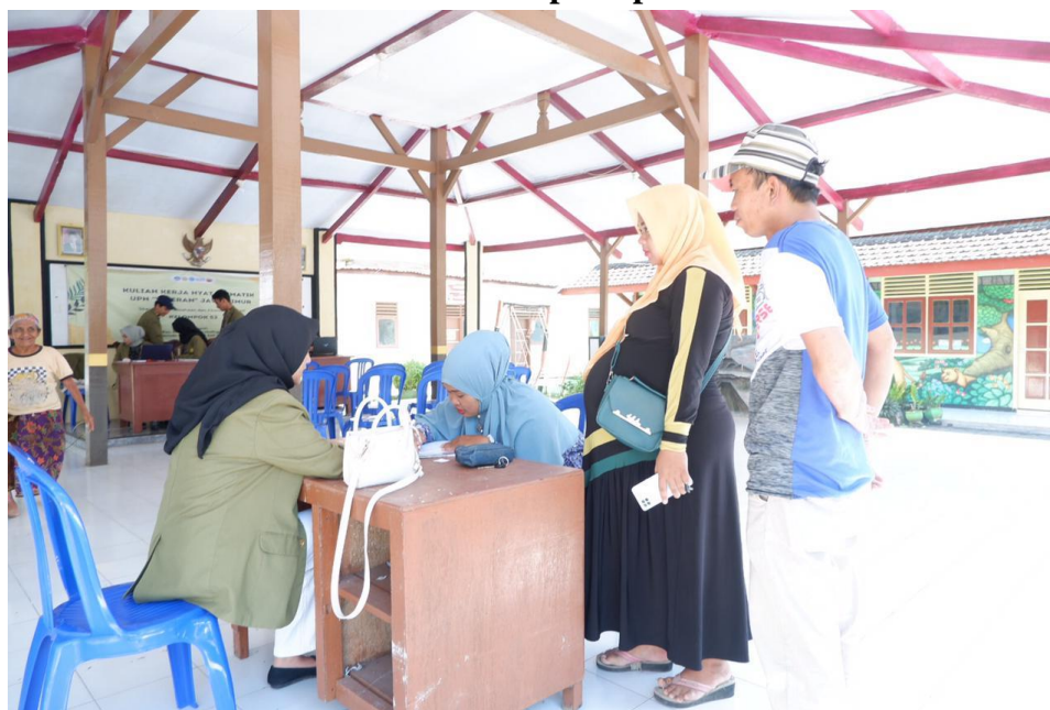
Gambar. 2 Pendataan pada pelaku UMKM

Kegiatan pertama adalah melakukan pendataan dan pemetaan pada keseluruhan jumlah UMKM di Desa Ngepoh yang terdiri dari tiga dusun yaitu dusun lajuk, dusun makam dan dusun krajan. Data UMKM ini didapatkan dari hasil pendataan yang telah dilakukan oleh perangkat desa dan sekaligus dari hasil survey KKN 53 di setiap UMKM yang ada di Desa Ngepoh, hal tersebut perlu dilakukan untuk memudahkan peserta KKN 53 dalam pelaksanaan di lapangan agar mengetahui secara jelas dan spesifik berapa jumlah dan letak UMKM di setiap dusunnya. Kemudian dilakukan pembuatan formulir isian yang terdiri dari data diri pelaku usaha dan data usaha itu sendiri yang diperlukan untuk memenuhi persyaratan pembuatan Nomor Induk Berusaha (NIB).