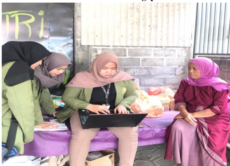
Gambar. 4 Pendampingan Pembuatan NIB Metode door to door dirumah para UMKM di Desa Ngepoh

Sementara metode yang dilakukan di minggu kedua pada hari rabu, 12 April 2022 dalam pembuatan Nomor Induk Berusaha (NIB) secara mandiri dengan didampingi oleh Mahasiswa KKNT 53 dilaksanakan di kediaman masing-masing UMKM yang disebut sebagai metode yaitu door to door . Metode ini dipilih karena dirasa sebagai cadangan metode yang mana membantu para UMKM yang tidak dapat hadir saat pelaksanaan pendampingan pembuatan Nomor Induk Berusaha di Balai Desa.