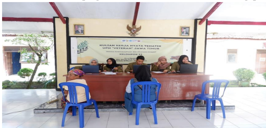
Gambar. 3 Pendampingan Pembuatan NIB di Balai Desa Ngepoh

pentingnya dan kegunaan Nomor Induk Berusaha bagi kelangsungan usaha yang dimilikinya. Kemudian Mahasiswa KKNT 53 juga memberikan sesi tanya jawab apabila terdapat hal yang belum dipahami oleh pelaku UMKM dalam pendampingan tersebut. Didalam pengajuan pembuatan Nomor Induk Berusaha (NIB) dibutuhkan persyaratan yaitu KTP, NPWP (opsional), Nomor Whatsapp atau Email. Peserta KKNT 53 memberikan pendampingan ini secara langsung dilakukan dengan tujuan agar meminimalisir kesalahan dan kekeliruan data dalam pengajuan pengisian formulir.