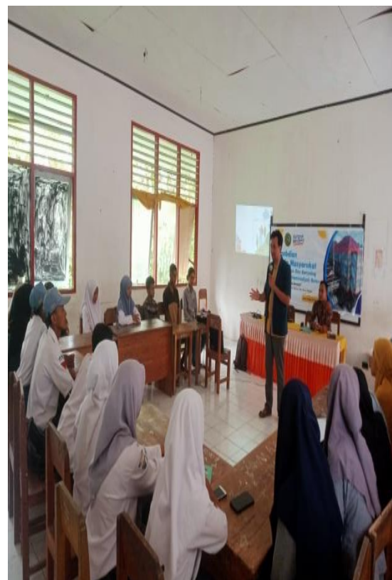
Gambar 1 : Penjelasan Materi Peminatan Karir Remaja Desa Waraa

Setelah peserta melakukan pengisian instrument peminatan karir Holland, selanjutnya disajikan hasil pengolahan data instrumen minat profesi Holland remaja di Desa Waara, Kabupaten Buton Tengah. Data minat profesi remaja Desa Waara dapat dilihat pada tabel 1 dibawah ini :