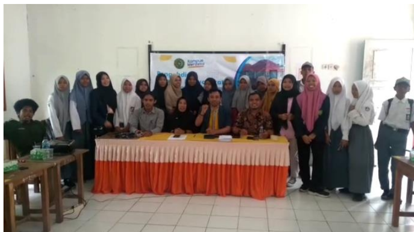
Gambar 3: Foto Bersama Remaja Karang Taruna Desa Waraa, Kec. Lakudo, Buton Tengah