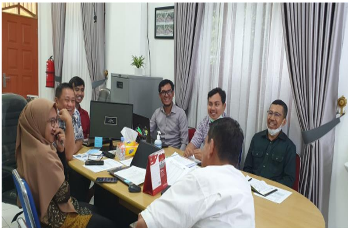
Gambar 2. Foto Pelaksanaan Kegiatan Masyarakat Bersama Yayasan Dan Kepala Sekolah