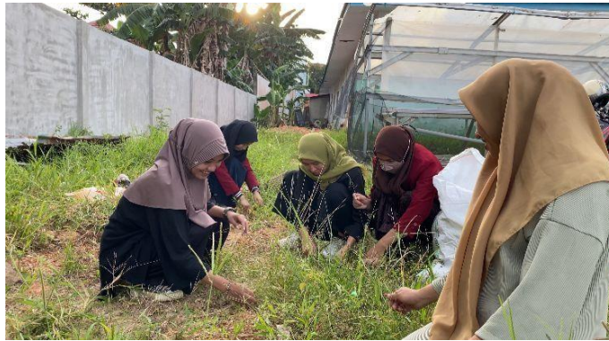
Gambar 3. Pembersihan lahan