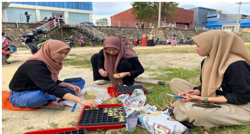
Gambar 2. Pembibitan bawang merah

kualitatif. Analisis deskriptif kualitatif pada penelitian ini yakni menjelaskan atau memaparkan tentang budidaya merah di lahan pekarangan secara hidroponik yang terdiri dari pengenalan alat dan bahan, penyusunan RAB pembuatan green house hingga teknik budidaya bawang merah menggunakan air sebagai media tanamnya.