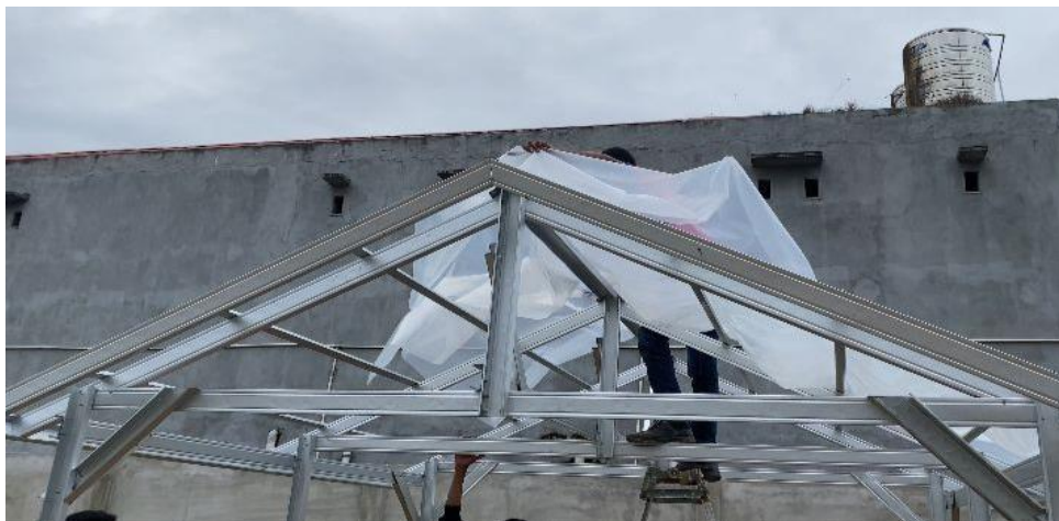
Gambar 6. Pemasangan Plastik UV

polietilen ini terbuat dari plastic atau kawat, Inscnet berfungsi menjaga atau menghalangi tanaman yang ada didalamnya dari serangan serangga atau hewan pengganggu agar tidak dapat masuk ke green house sebagai tempat tanaman. Untuk ukuran green house 3x3 meter membutuhkan plastic UV sebanyak 15 meter dan insectnet.