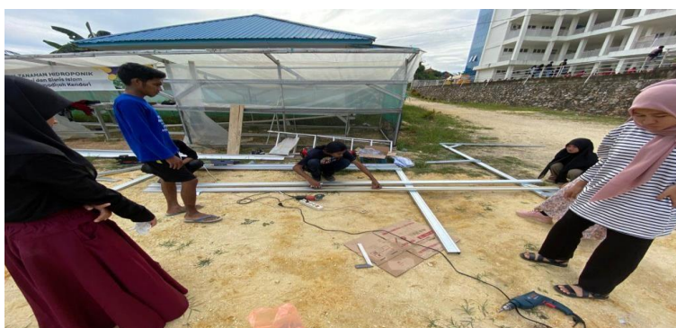
Gambar 1. Persiapan Pembuatan Green House

Ketidakpastian produksi dan tingginya permintaan masyarakat terhadap bawang merah menyebabkan terjadinya kenaikan harga yang dapat memicu terjadinya inflasi. Kantor Perwakilan Bank Indonesia Sulawesi Tenggara (Sultra) menyebutkan bahwa komoditas bawang merah di Sulawesi Tenggara selalu mengalami deficit setiap tahunnya dan sangat bergantung pada suplay dari daerah lain yakni Jawa, Sulawesi Selatan dan Nusa Tenggara Barat (NTB). Selain itu data dari Badan Pusat Statistik (BPS, 2022) ,Inflasi di Provinsi Sulawesi Tenggara pada tahun 2022 menduduki posisi kedua setelah Provinsi Sumatera Barat yakni 7,9% dan bawang merah penyumbang inflasi terbesar.