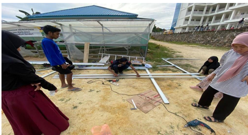
Gambar 5. Pembuatan Green House Ukuran 3x3 meter

Selanjutnya, membangun rangka green house sesuai dengan desain yang diinginkan. Bahan yang dibutuhkan berupa baja ringan dan Canal C Agar green house tampak rapi dan tidak ditumbuhi gulma maka lantai green house harus difloor.