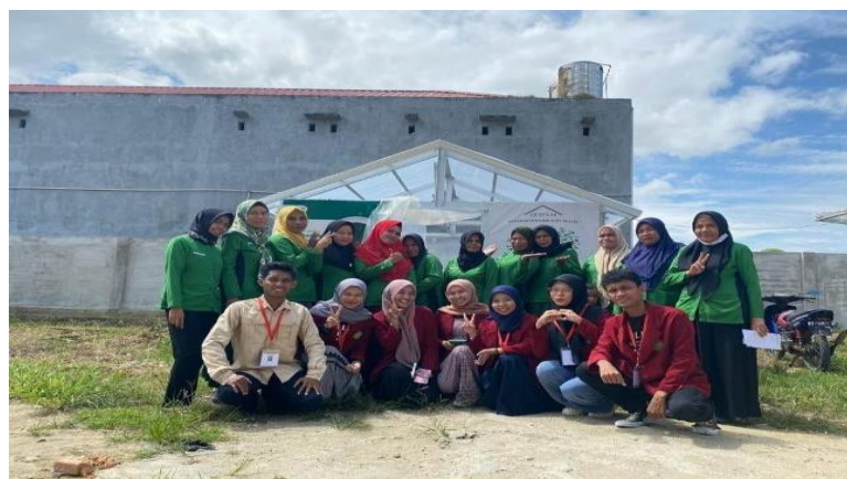
Gambar 9. Sosialisasi dan Edukasi Gertani

Sosialisasi mencakup interaksi sosial dan tingkah laku sosial, sehingga sosialisasi merupakan mata rantai yang penting diantara system sosial. Menurut Sutaryo (2004), sosialisasi merupakan suatu proses memperkenalkan system pada seseorang serta menentukan tanggapan serta reaksinya. Edukasi adalah segala keadaan, hal, peristiwa, kejadian atau tentang suatu proses pengubahan sikap dan tata laku seseorang atau kelompok dalam usaha mendewasakan manusia. Edukasi dilakukan melalui upaya pengajaran dan pelatihan.