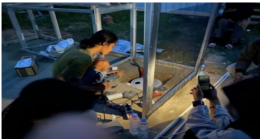
Gambar 7. Pemasangan mesin air dan wadah penampung air