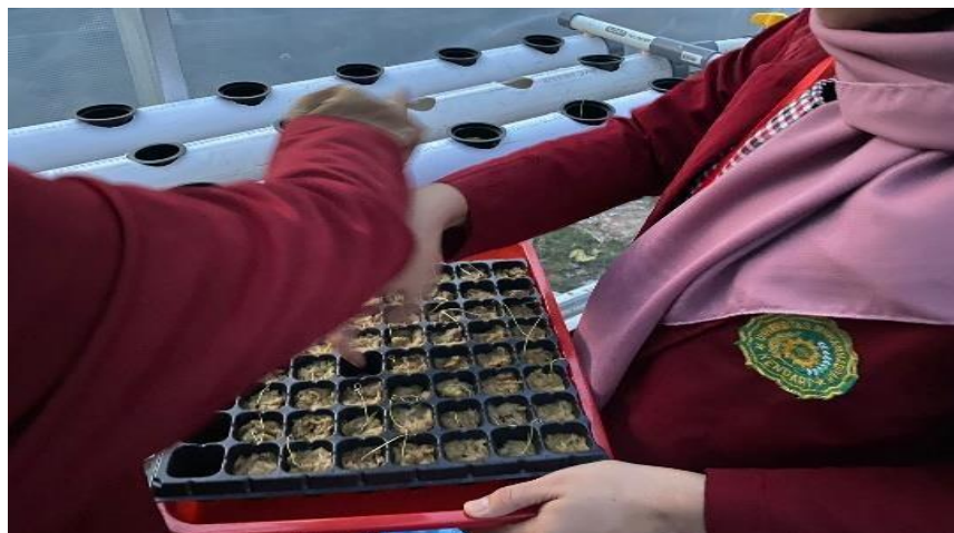
Gambar 8. Pemindahan bibit bawang merah ke Net Pot

Pemindahan bibit pada tanaman dalam budidaya hidroponik dilakukan Ketika tanaman sudah memiliki bentuk daun yang sempurna yaitu Ketika berumur 7-10 hari setelah penyemaian. Pemilihan umur bibit yang tepat penting dilakukan agar perakaran tanaman siap untuk beradaptasi dengan lingkungan pertanaman.