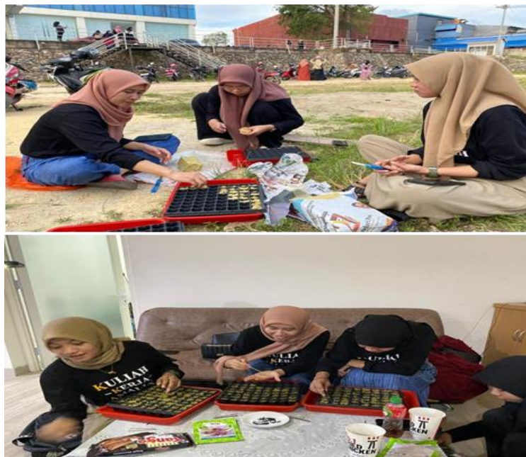
Gambar 4. Penyemaian bawang merah

Pada proses ini, bibit yang sudah disemai harus mendapatkan sinar matahari yang cukup sehingga bibit yang sudah dimasukkan ke dalam talang semai harus dijemur di bawah sinar matahari antara pukul 09.00 – 11.00 WITA