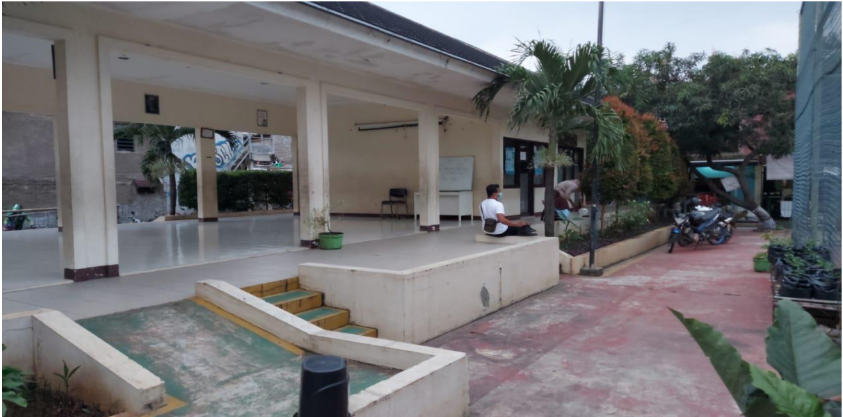
Ruang Publik Terpadu Ramah Anak (RPTRA) Rasamala Tebet Jakarta Selatan.

Permasalahan yang dihadapi oleh warga pedagang sekitar RPTRA Rasamala ini adalah terbatasnya pengetahuan mereka tentang komunikasi virtual yang baik dan penggunaan media digital. Untuk itu lah diperlukan adanya pembekalan tentang komunikasi virtual yang baik dan media digital masalah tersebut sehingga warga di sekitar RPTRA Rasamala mampu meningkatkan kemampuan dan ketrampilan berkomunikasi virtual yang baik mereka melalui penggunaan media digital, sehingga mereka dapat tercegah dari kekerasan siber pada perempuan dan anak. Berikut gambaran RPTRA Rasamala Tebet Jakarta Selatan.