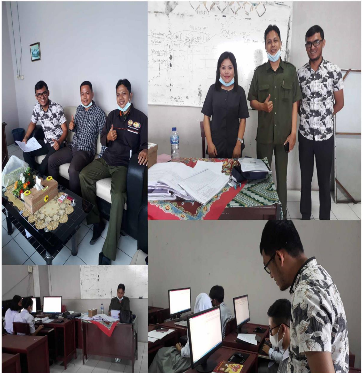
Gambar 2. Foto Pelaksanaan Kegiatan Masyarakat Bersama kepala sekola, guru, dan siswa

Hasil evaluasi setelah pelaksanaan kegiatan adalah :