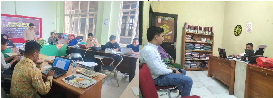
Gambar 4.1 Pendampingan Hukum