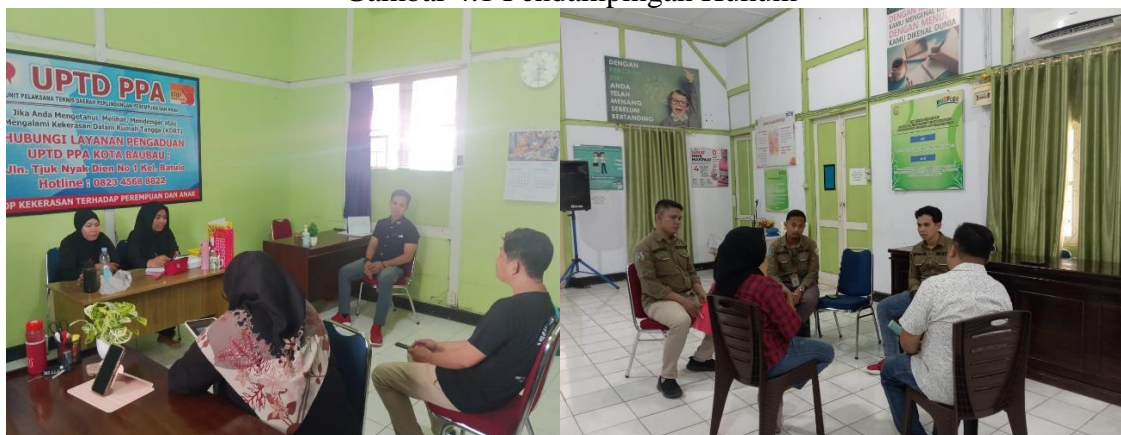
Gambar 4.1 Pendampingan Hukum