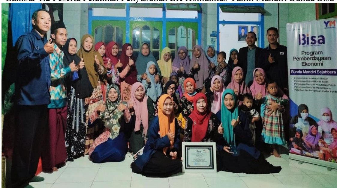
Gambar 1.2 Peserta Pelatihan Penyusunan LK Komunitas Yatim Mandiri Bunda Bisa