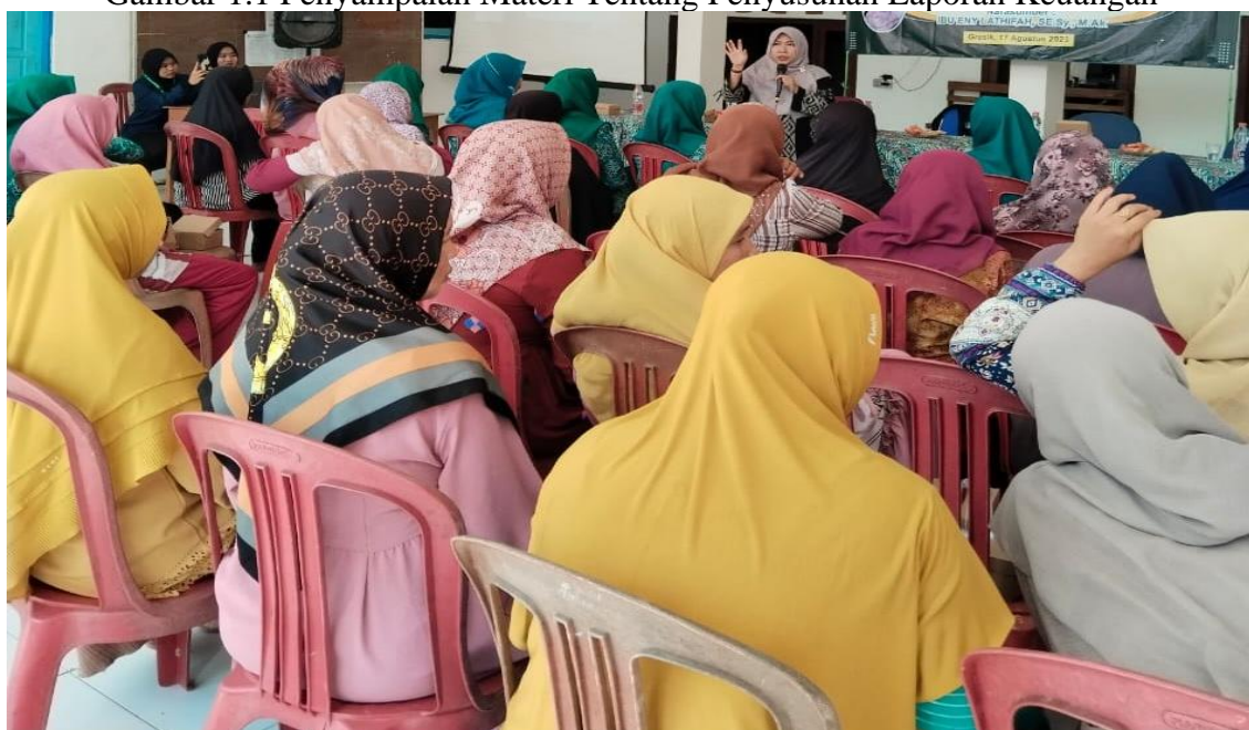
Gambar 1.1 Penyampaian Materi Tentang Penyusunan Laporan Keuangan