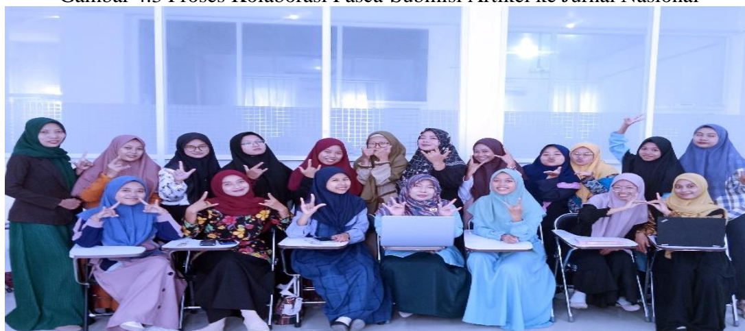
Gambar 4.3 Proses Kolaborasi Pasca-Submisi Artikel ke Jurnal Nasional

Di era disruption sangat penting untuk menciptakan peluang melalui karya tulis yang terpublikasi. Kajian intelektual yang dilaksanakan KSEI Al-Musthofa seringkali memberikan refleksi keilmuan bagi mahasiswa khususnya dalam penugasan karya tulis baik berupa buku, artikel, opini, puisi atau lainnya. Secara tidak langsung mahasiswa memiliki peran penting dalam optimalisasi bagi penulis atau penelitian yang telah dipublikasikan sebagai jejak digital atas hasil pemikiran dan upaya dalam menorehkan karya untuk diabadikan. Semangat ini tentunya dilakukan dengan menciptakan peluang yang datang di depannya untuk menambah karya digital, selain itu mahasiswa mendapatkan supplay atas prestasi non-akademik yang nantinya akan mereka jadikan kredit dalam penilaian SKPI (Surat Keterangan Pendamping Ijazah). Apapun peluang diharapkan mampu meningkatkan karya dan meningkatkan kreatifitas dalam menulis bagi mahasiswa atau pihak-pihak lainnya yang terkait dalam kajian intelektual KSEI Al-Musthofa.