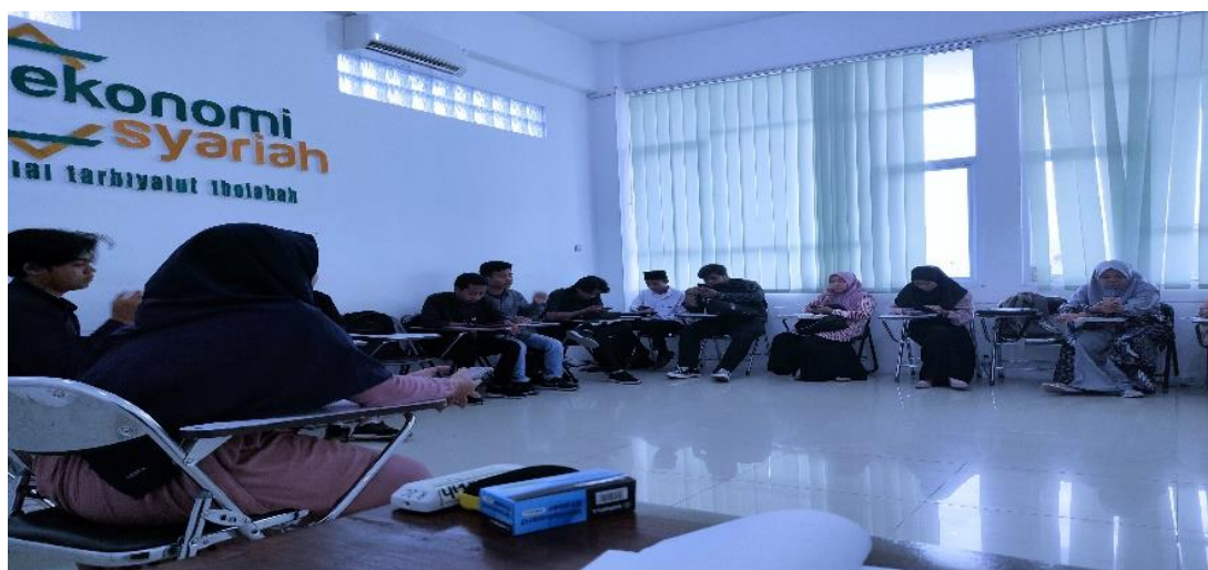
Gambar 4.2. Diskusi di Ruang Kelas (Kampus)

Dalam metode diskusi sekiranya dapat memberikan peluang peningkatan skill dalam debat dan keberanian dalam mengungkapkan pemikiran dan solusi terkait topik yang diangkat dalam kajian yang dilaksanakan. Diskusi sebagai media dakwah dalam kajian intelektual dapat memberikan penambahan kebendaraan referensi atas permasalahan yang tidak dijelaskan lebih luas dalam ruang perkuliahan. Selain itu diskusi akan memberikan peluang mahasiswa meningkatkan keterampilan berfikir kritis, memperkaya pengalaman, mempererat hubungan sosial, meningkatkan kepercayaan diri, mengurangi konflik dan yang terpenting adalah pembentukan karakter.