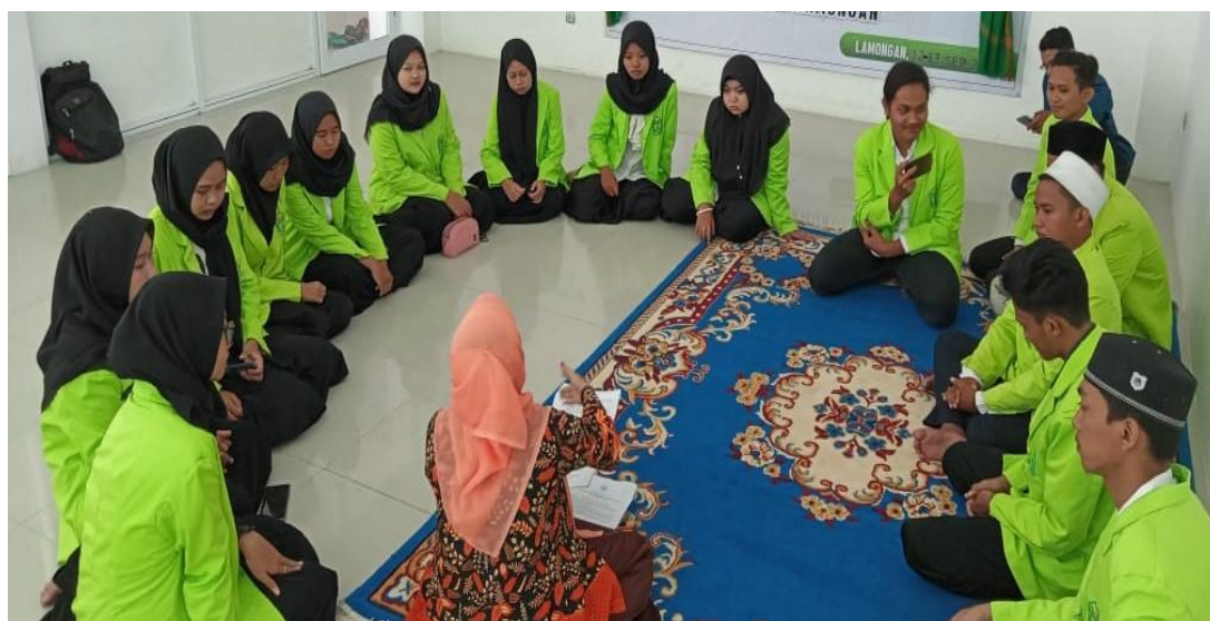
Gambar 4.1 Pemberian Ceramah Kajian Studi Ekonomi Syariah

Secara visual kegiatan ceramah dalam Kajian Studi Ekonomi Syariah dapat dilihat dari gambar dibawah ini: