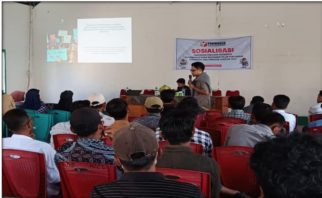
Gambar 1: Pemaparan Materi Seminar