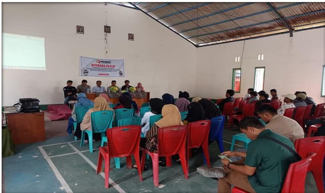
Gambar 2: Diskusi Peserta Seminar