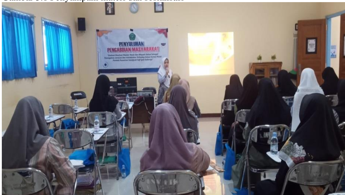
Gambar 3.1 Penyampain materi dan sosialisasi