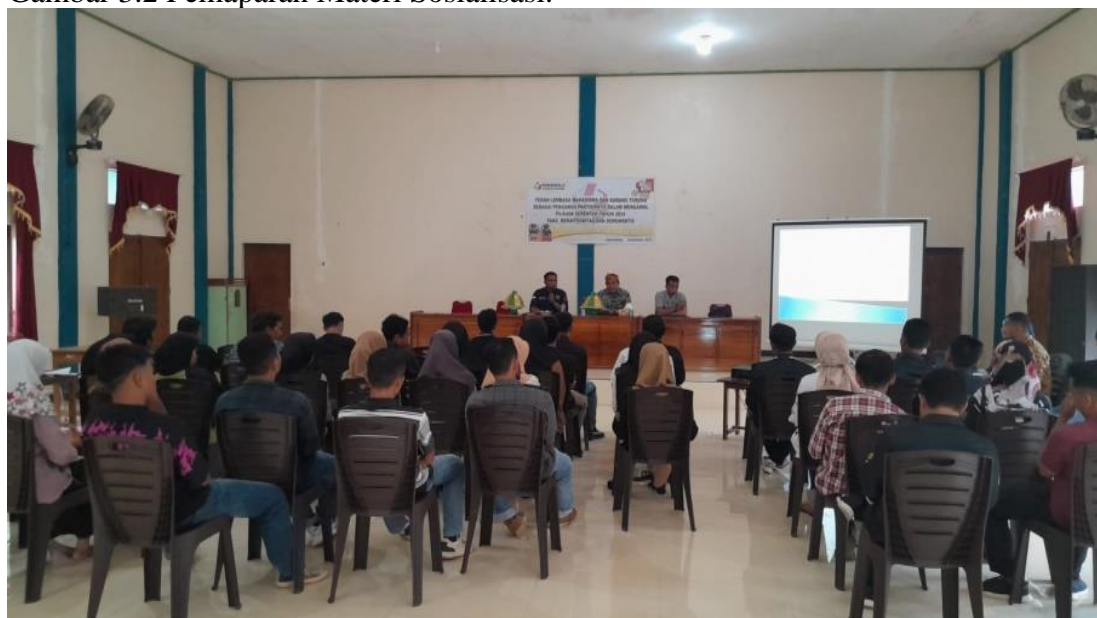
Gambar 3.2 Pemaparan Materi Sosialisasi.