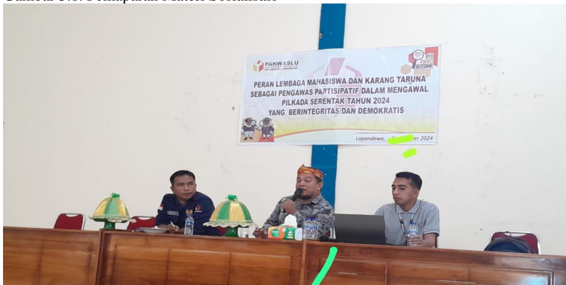
Gambar 3.1. Pemaparan Materi Sosialisasi