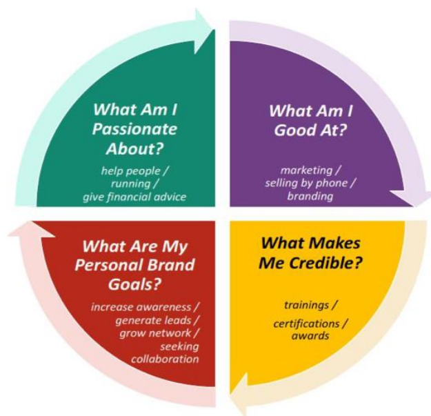
Gambar 6. Materi Pelatihan Personal Branding

Terdapat empat pertanyaan utama yang ditanyakan kepada diri sendiri sebelum memulai personal branding