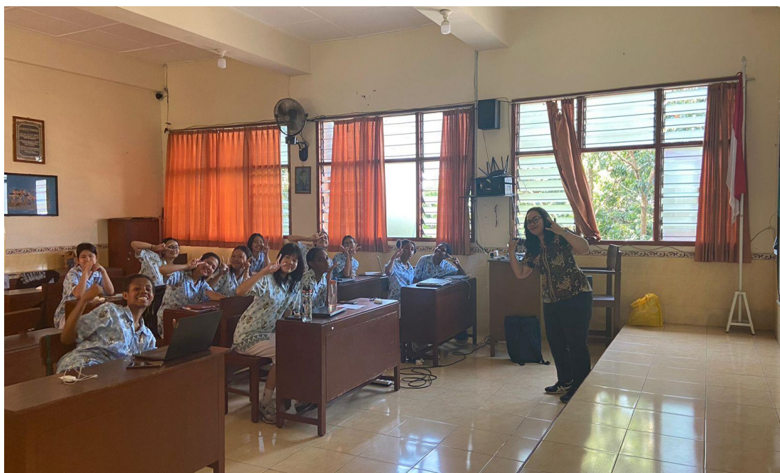
Gambar 2. Pemberian Materi Public Speaking

Kegiatan pelatihan public speaking dilakukan untuk melatih siswi-siswi berkomunikasi secara lisan untuk menyampaikan ide, gagasan, pesan dan pendapat yang bertujuan menginformasikan, menghibur, mempengaruhi dan dilakukan didepan audiens dengan metode dan struktur tertentu.. Kompetensi Public Speaking diharapkan dapat dipahami dan dipraktikkan dalam menunjang efektivitas pelaksanaan kegiatan belajar bagi siswa sejak dini agar dalam kegiatan dikelas (misal: presentasi tugas) semakin mumpuni. Dengan public speaking maka diharapkan siswa mampu melakukan presentasi atau apapun dengan intonasi yang baik, body language yang baik dan lainnya. Inti materi public speaking kali ini adalah memberikan pemahaman bagi siswa terkait dengan intonasi saat berbicara di depan umum, memberikan pemahaman bagi siswa terkait dengan body language/gaya tubuh yang tepat saat berbicara di depan umum, memberikan tips dan trik bagaimana meningkatkan kepercayaan diri siswi saat berbicara didepan umum dan praktik langsung serta evaluasi. Berikut adalah beberapa dokumentasi saat kegiatan pelatihan berlangsung :