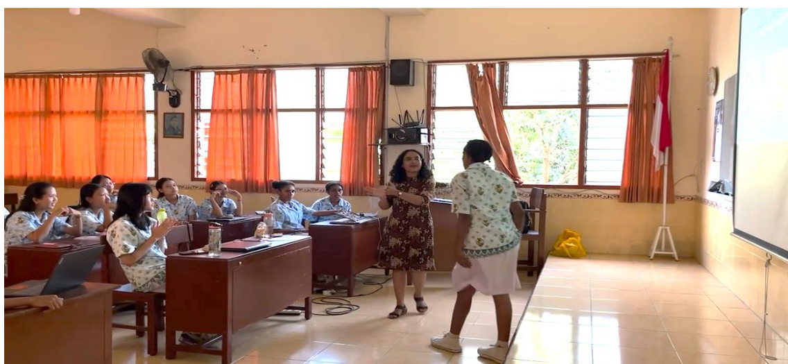
Gambar 4. Pemberian Materi dan Praktik Personal Branding

Tujuan dari personal branding adalah untuk mempengaruhi orang lain, memberikan kesempatan bagi mereka untuk mengenali keunikan diri, serta menunjukkan keunggulan dan potensi yang dimiliki. Inti materi personal branding yang diberikan kepada siswi SMA Santa Maria Yogyakarta meliputi pemahaman tentang apa itu personal branding , cara membentuk personal branding yang sesuai dengan individu, manfaat dan tujuannya, serta praktik langsung dan evaluasi. Berikut adalah beberapa dokumentasi kegiatan selama pelatihan berbicara di depan umum berlangsung: