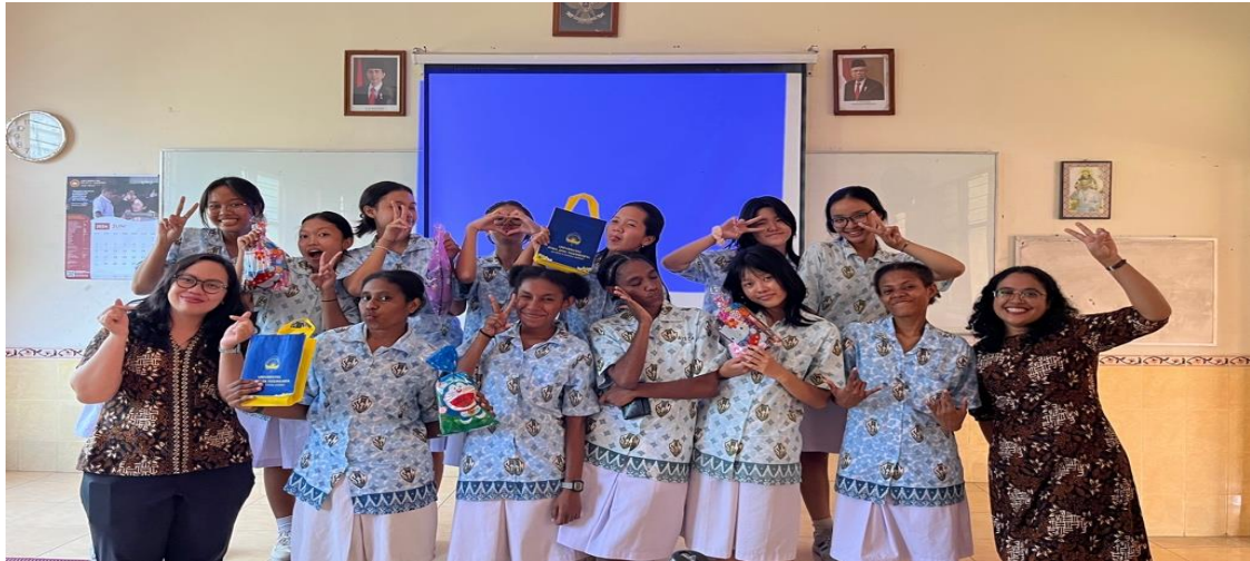
Gambar 5. Tim Pengabdian bersama Siswi SMA Santa Maria Yogyakarta