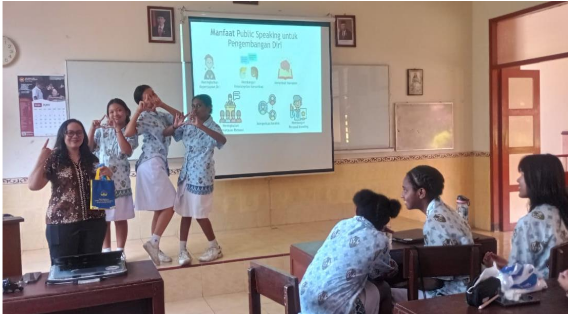
Gambar 3. Praktik Langsung Public Speaking