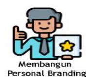
Gambar 4. Materi Pelatihan Public Speaking

Dari hasil pelatihan terkait public speaking , diperoleh tanggapan dari siswi-siwi bahwa memang benar mereka sangat membutuhkan pelajaran public speaking karena