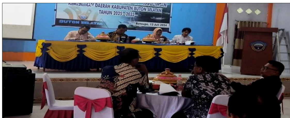
Gambar 2: Pemaparan Materi Seminar UMKM