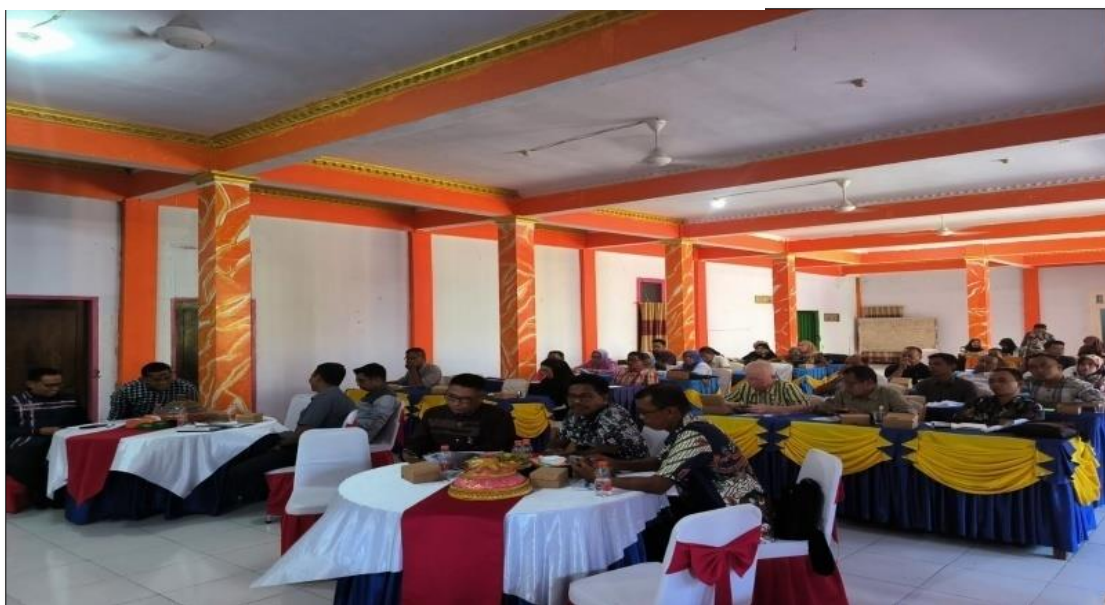
Gambar 3: Diskusi Peserta Seminar UMKM