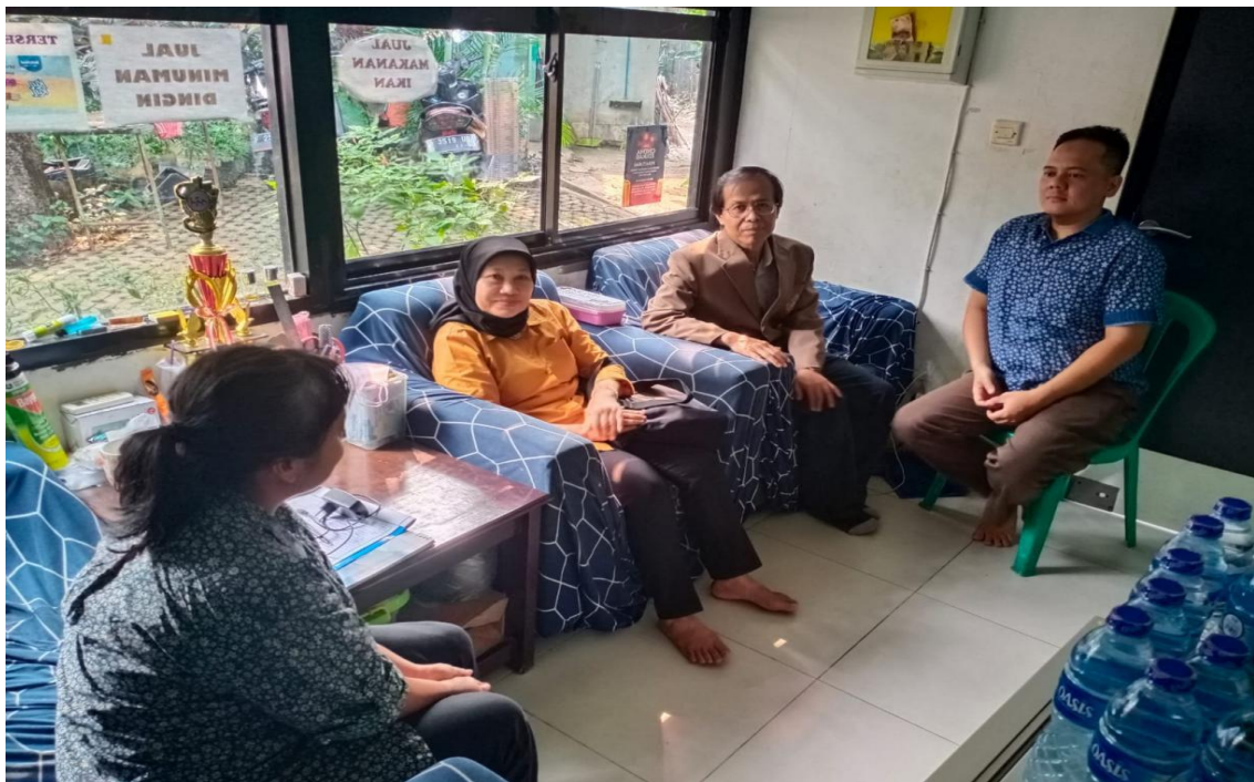
Dokumentasi 3.1. Pertemuan PKM Dengan Mitra