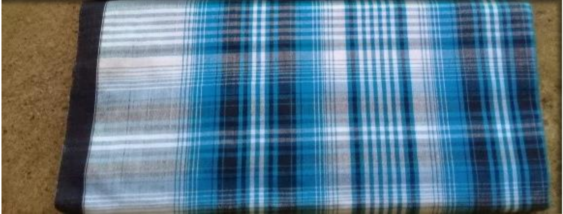
Gambar 1. Motif Tenun Katamba Gawu

cukup sakral dalam pemahaman masyarakat lokal Buton. Bisa dibayangkan hal yang berhubungan dengan perasaan tertentu seperti suasana duka yang mengharu biru juga tidak luput dari imajinasi masyarakat Buton untuk diterjemahkan warna dan motif kain tenun itu sendiri.