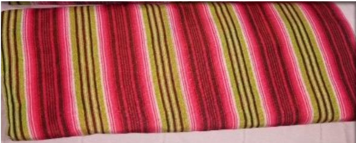
Gambar 2. Motif tenun Bulamalaka

Ada lagi motif Bulamalaka yang terinspirasi dari tanaman jambu biji. Telah diungkapkan di awal tentang motif, warna motifnya kombinasi dari beberapa jenis warna yakni merah, hijau, merah muda, hitam serta coklat. Adapun jenis warna yang melekat pada kain ini mengikuti filosofi dari tanaman jambu biji, yakni merah dan merah muda diambil dari makna warna dagingnya, hitam berasal dari warna tangkainya, warna coklat yakni yang melekat pada pohonnya, kemudian warna hijau diambil dari daunnya. Dilihat dari sisi asas manfaat dari jenis tanaman ini, pohon jambu biji memiliki banyak kegunaan dari sisi medis selain sebagai buah yang segar dan memiliki rasa yang cukup manis dan lezat. Artinya masyarakat Buton juga memanfaatkan tanaman jambu biji ini untuk keperluan obat-obatan. Kegunaan tanaman ini sebetulnya yang menginspirasi para pengrajin tenun untuk menggunakan buah jambu ini sebagai inspirasi motif tenun. Lebih