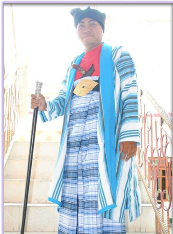
Gambar 4. Jubah Lau Ogena

Lebih lanjut disebutkan bahwa untuk golongan Walaka identitas penggunaan motif tenunnya tidak terlalu mencolok dan terkesan biasa saja. Karena secara hirarki sebenarnya golongan Kaomu ini juga disebut sebagai golongan anak sedangkan Walaka adalah golongan bapak. Jadi yang sifatnya kebesaran, kejayaan, kemegahan (dari kaum walaka) ini sudah diberikan kepada anak-anaknya. Sehingga secara filosofi golongan bapak harus mundur dengan menggunakan motif yang biasa saja, karena kemewahan yang dia punya sudah diserahkan kepada anaknya. Terkait penggunaan tenun dalam stratifikasi sosial seperti ini, masyarakat Buton sangat detail dan menjunjung tinggi nilai dari setiap unsur yang melekat dalam tradisi dan budaya mereka sendiri.