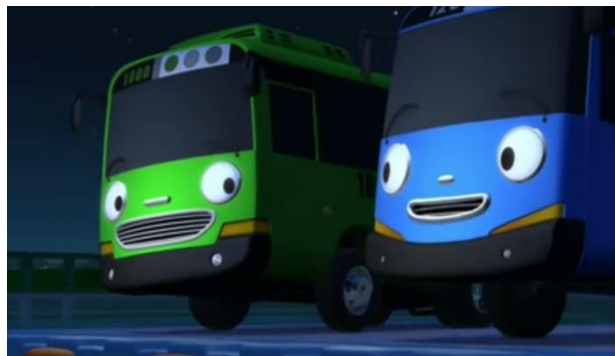
Gambar 3. Tayo dan Rookie saling memaafkan

Terlihat disini jika rookie dan tayo mereka menyesal karena telah berkelahi dan menyebabkan mereka terjebak di sungai ini, permintaan maaf diawali dari rookie yang kemudian tayo punjuga meminta maaf kepada rookie, seperti yang kita tahu saling memaafkan merupakan merupakan indikator dari nilai-nilai moral yang harus ditanamkan pada anak usia dini menurut (Untari & Farida, 2016)