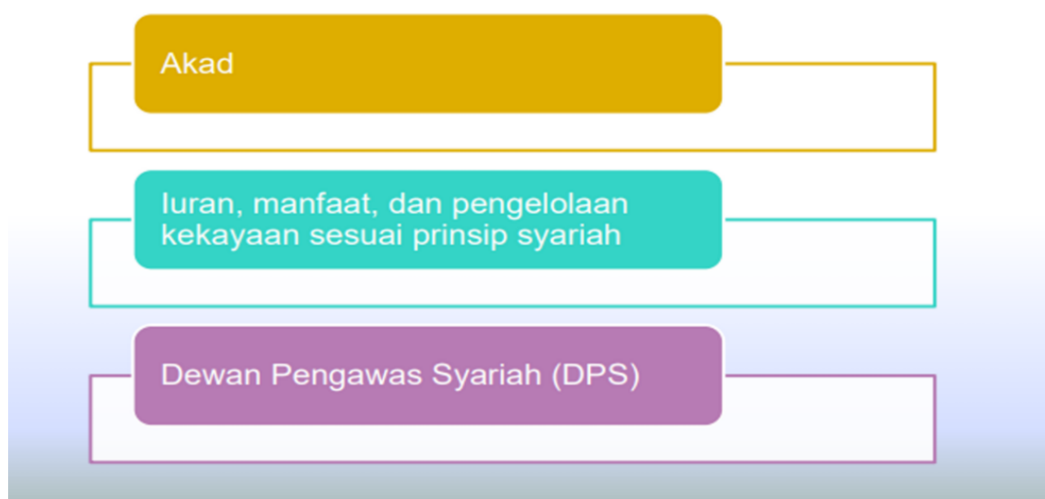
Gambar 4.1 Dasar Pengelolaan Dana Pensiun