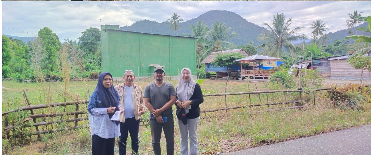
Gambar 3. Melakukan Kunjungan Kelokasi Sarang burung walet.