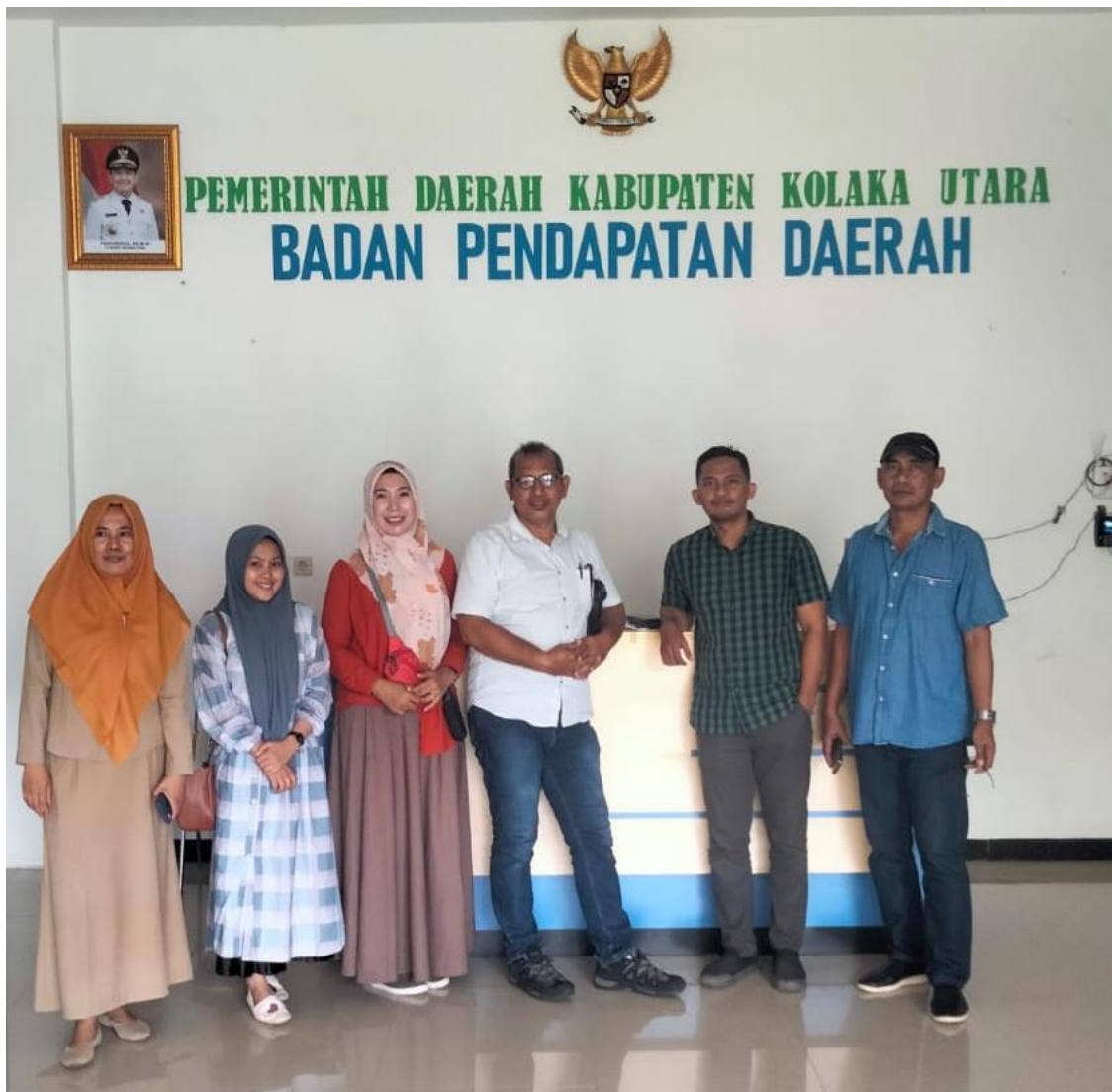
Gambar 1. Foto Bersama Tim Sosiaslisasi dan Perwakilan Dispenda Kabupaten Kolaka

Pada gambar 1. Dilakukan foto bersama Tim Sosiaslisasi Sosiaslisasi (Dosen Program Studi Manajemen Universitas Muhammadiyah Kendari dan Perwakilan Kantor Dinas Pendapatan Kolak Utara setelah melakukan rapat koordinasi untuk mensosialisasikan Pajak Sarang Walet bagi pelaku usaha Sarang Walet Pada sesi ceramah, narasumber menyampaikan materi mengenai pentingnya membayar pajak dan kewajiban perpajakan bagi pelaku usaha burung walet. Materi ini mencakup dasar-dasar perpajakan, jenis-jenis pajak yang harus dibayar, tata cara pelaporan dan pembayaran pajak, serta sanksi yang berlaku bagi wajib pajak yang tidak patuh. Hal ini sesuai dengan pernyataan Mardiasmo (2016) bahwa "wajib pajak harus memahami kewajiban perpajakannya, mulai dari menghitung, membayar, dan melaporkan pajak terutangnya.