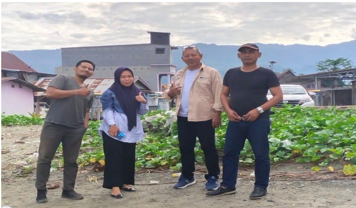
Gambar 4. Kunjungan kelokasi salah satu petani Sarang burung walet.