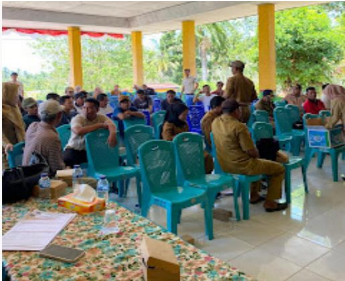
Gambar 2. Peserta Kegiatan Sosialisasi pajak sarang burung walet di kantor Camat Watunohu Kab. Kolaka Utara

Selanjutnya, sesi diskusi dan tanya jawab memberikan kesempatan bagi peserta untuk mengajukan pertanyaan dan mengklarifikasi hal-hal yang masih kurang dipahami. Beberapa pertanyaan yang diajukan oleh peserta meliputi perhitungan pajak yang harus dibayar, perlakuan pajak atas biaya-biaya yang dikeluarkan dalam usaha burung walet, serta cara menghadapi pemeriksaan pajak. Menurut Pohan (2016), "pemahaman yang baik atas peraturan perpajakan akan membantu wajib pajak dalam melaksanakan kewajiban perpajakannya secara benar. Narasumber memberikan penjelasan yang rinci dan disertai dengan contoh-contoh kasus yang relevan dengan usaha burung walet. Peserta tampak antusias dan terlibat aktif dalam sesi diskusi dan tanya jawab ini. Afrizal (2018) menyatakan bahwa "kesadaran wajib pajak merupakan faktor penting yang mempengaruhi kepatuhan wajib pajak