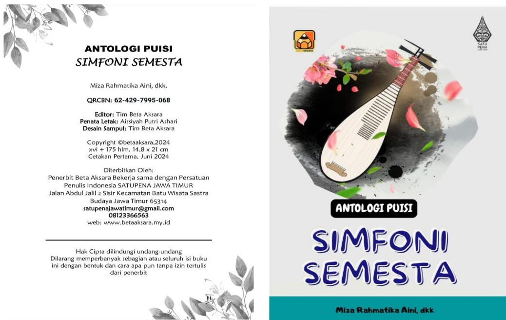
Hasil cetak buku antologi puisi

Reading for Literature and Culture. Mahasiswa mata kuliah ini menulis puisi dan mengumpulkannya selama bulan April-Hingga Mei dan menerjemahkannya dalam bahasa Inggris. Puisi dua bahasa ini telah rilis dan dalam proses cetak. Puisi ini terdiri dari bahasa Indonesia dan bahasa Inggris. Tema dari buku antologi puisi ini beragam. Ada tma cinta, persahabatan bahkan hewan peliharaan