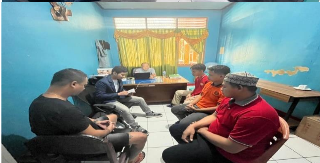
Dokumentasi Pemberian Motivasi Kepada Warga Binaan Lapas Kelas IIA Baubau